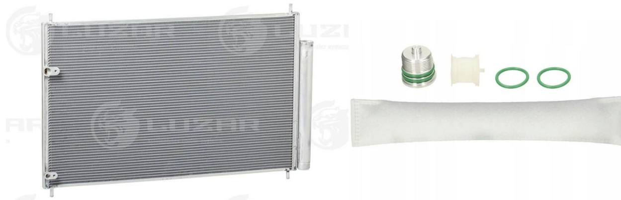
На фото радиатор кондиционера LUZAR LRAC 1980 с интегрированным ресивером-осушителем и осушитель с фильтром сеткой и крышкой с прокладками

Осушитель требует замены при любом ремонте связанным с разгерметизацией системы кондиционирования. Если пришедший в негодность осушитель не заменить, это приведет к выходу из строя другие, более дорогостоящие компоненты системы кондиционирования, в том числе компрессор кондиционера. При замене компрессора кондиционера, замена осушителя обязательна!